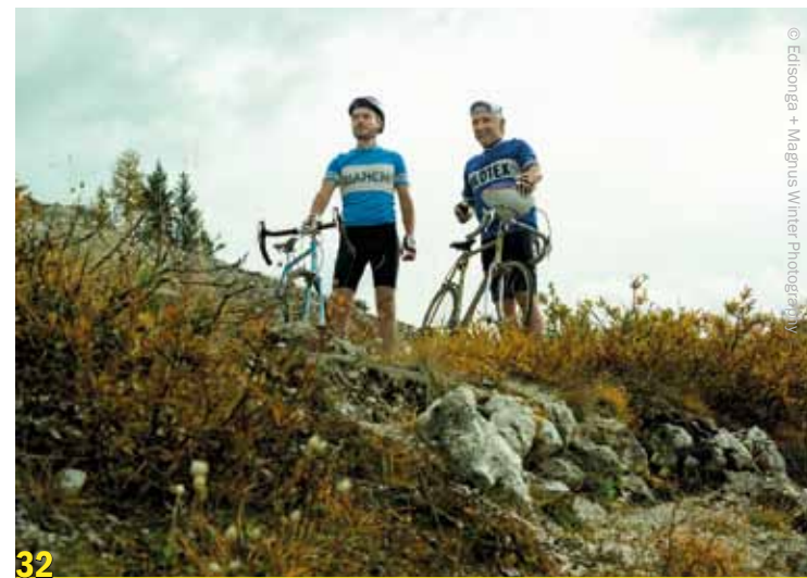
Mit Content Campaigning wird die Consorsbank-Kampagne auf ein neues Level gehoben