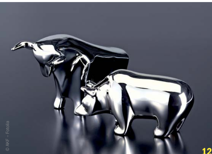
CP-Instrumente der DAX-Unternehmen: Ohne Social Media läuft nichts