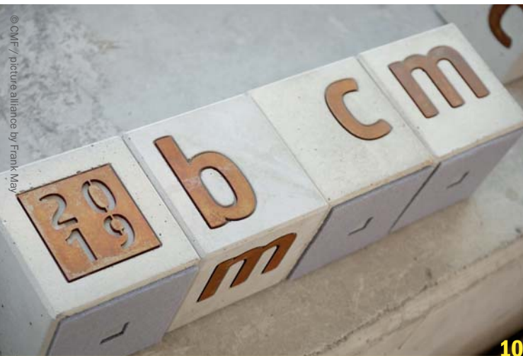
16. Best of Content Marketing Award in Hamburg